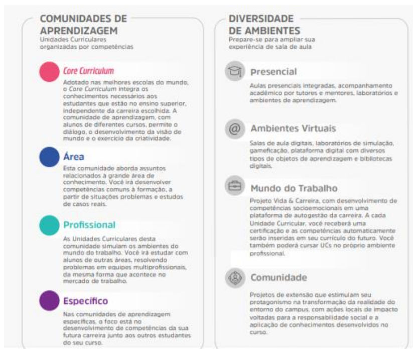
Figura 1 – Comunidades de aprendizagem e diversidade de ambientes

Assim, durante o seu percurso formativo, o estudante desenvolve, de forma flexível e personalizada, conforme perfil do egresso, as competências, conhecimentos, habilidades e atitudes de trabalho em equipe, resolução de problemas, busca de informação, visão integrada e humanizada.