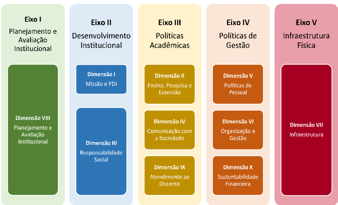
Figura 2 – Eixos e dimensões do SINAES

Essa autoavaliação, realizada em todos os cursos da IES, a cada semestre, de forma quantitativa e qualitativa, atenderá à Lei do Sistema Nacional de Avaliação da Educação Superior (SINAES), nº 10.8601, de 14 de abril de 2004. A legislação irá prever a avaliação de dez dimensões, agrupadas em 5 eixos, conforme ilustra a figura a seguir.