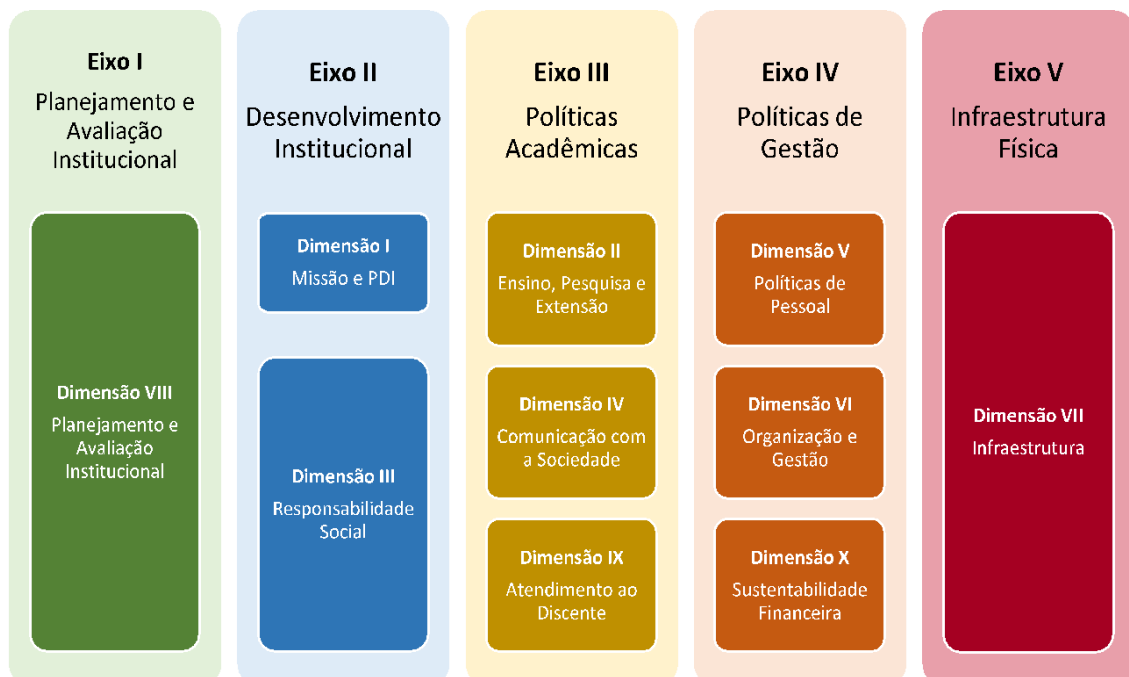
Figura 2 – Eixos e dimensões do SINAES

Essa autoavaliação, realizada em todos os cursos da IES, a cada semestre, de forma quantitativa e qualitativa, atenderá à Lei do Sistema Nacional de Avaliação da Educação Superior (SINAES), nº 10.8601, de 14 de abril de 2004. A legislação irá prever a avaliação de dez dimensões, agrupadas em 5 eixos, conforme ilustra a figura a seguir.