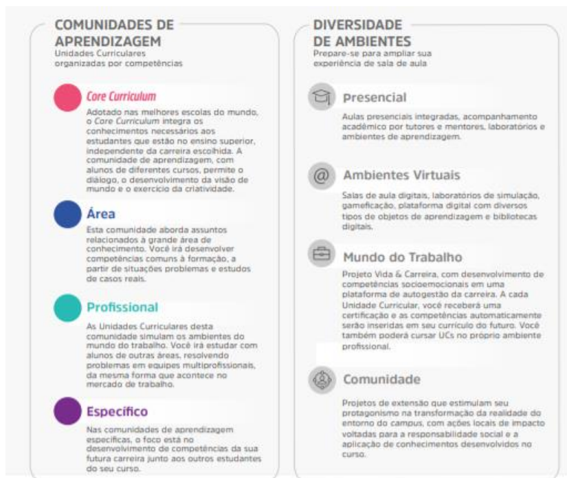
Figura 1 – Comunidades de aprendizagem e diversidade de ambientes

A flexibilidade do Currículo Integrado por Competências permite ao estudante transitar por diferentes comunidades de aprendizagem alinhadas aos seus respectivos eixos de formação. O percurso formativo é flexível, fluído, e ao final de cada unidade curricular o aluno atinge as competências de acordo com as metas de compreensão estudadas e vivenciadas ao longo do semestre.