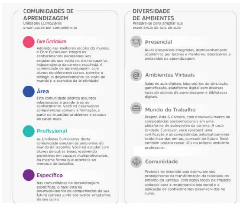
Figura 1 – Comunidades de aprendizagem e diversidade de ambientes

A flexibilidade do Currículo Integrado por Competências permite ao estudante transitar por diferentes comunidades de aprendizagem alinhadas aos seus respectivos eixos de formação. O percurso formativo é flexível, fluído, e ao final de cada unidade curricular o aluno atinge as competências de acordo com as metas de compreensão estudadas e vivenciadas ao longo do semestre.