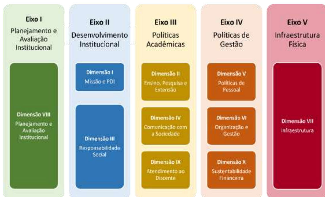
Figura 2 – Eixos e dimensões do SINAES

Essa autoavaliação, realizada em todos os cursos da IES, a cada semestre, de forma quantitativa e qualitativa, atenderá à Lei do Sistema Nacional de Avaliação da Educação Superior (SINAES), nº 10.8601, de 14 de abril de 2004. A legislação irá prever a avaliação de dez dimensões, agrupadas em 5 eixos, conforme ilustra a figura a seguir.